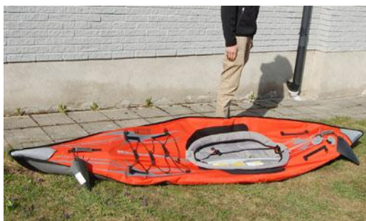
3. Veckla ut kajaken