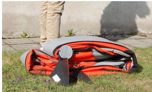
2. Ta ut kajaken ur väskan