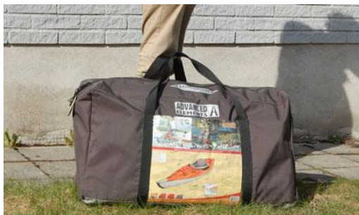
1. Kajaken i väska